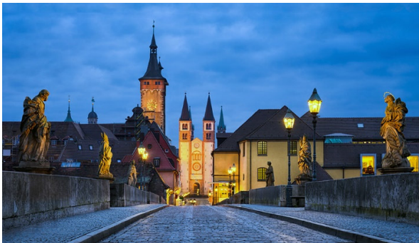
Abendstimmung in Würzburg