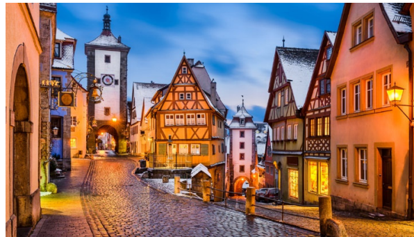
Ausflug nach Rothenburg ob der Tauber