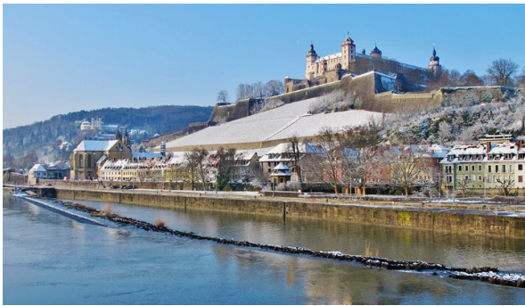
Würzburg im winterlichen Kleid

Würzburg lockt zur Winterzeit mit der bezaubernden Altstadt am Main. Strahlender Mittelpunkt ist die fürstbischöfliche Residenz. Geplant als «Schloss über allen Schlössern» nimmt sie die Besucher als barockes Gesamtkunstwerk gefangen und gehört aus diesem Grund zum Welterbe der UNESCO. Genießen Sie die Weihnachtstage mit uns in einem schönen Hotel in Würzburg und bei einem abwechslungsreichen Rahmenprogramm.